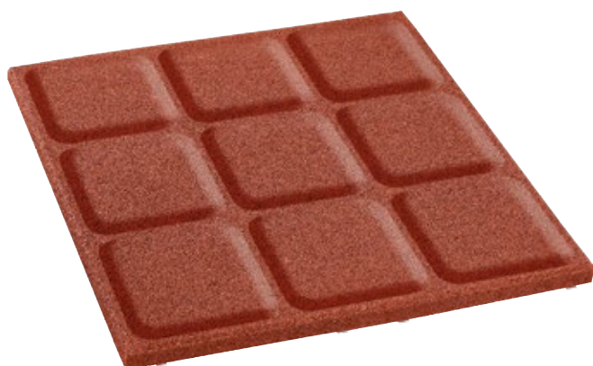
Face arrière 400 x 400 mm