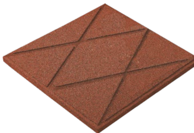
Face arrière 500 x 500 mm