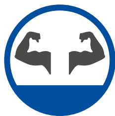
Hochresistenter, langlebiger Werkstoff