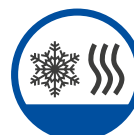
Frost- und wetterbeständig