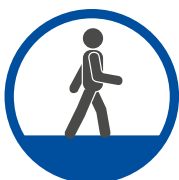
Vermindert Ermüdungserscheinungen in Füßen, Beinen und Rücken