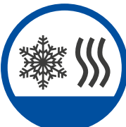
Schutz vor Nässe und Kälte