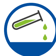
Resistent gegenüber Ölen, Fetten und vielen Chemikalien